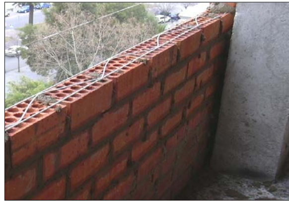
Fig. 1: Colocación de armadura de tendel en la hoja principal

Cuando tengamos fábricas armadas también puede haber problemas debidos a la corrosión de los componentes metálicos (armaduras de tendel, angulares de apoyo, rigidizadores transversales, etc.).