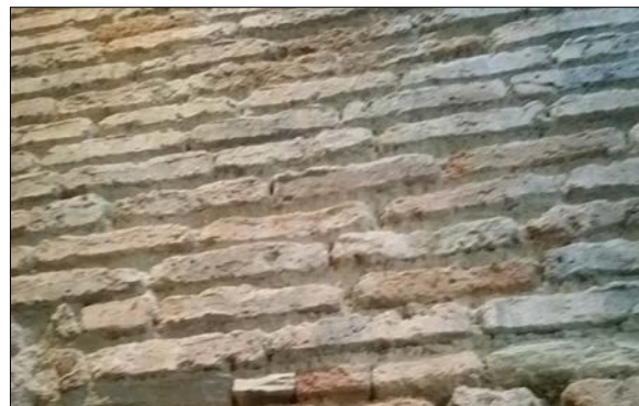
Fig. 2: Fábrica antigua con ladrillos del tejatle dispuestos a soga